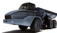
ШАРНИРНО- СОЧЛЕНЕННЫЕ САМОСВАЛЫ